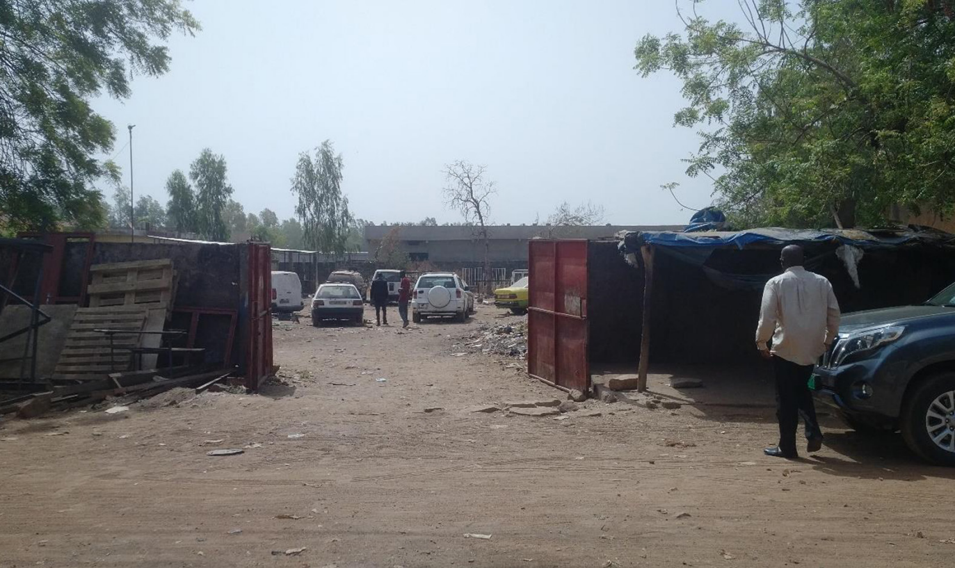
◀ Entrada principal desde Rue 96