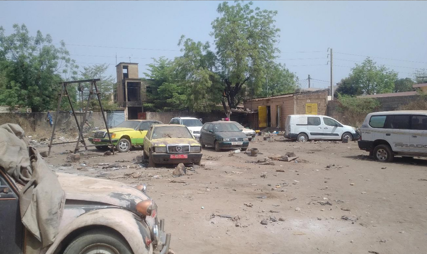
◀ Interior parcela (de Sur hacia Norte)