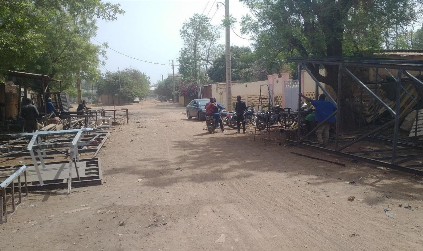
◀ Vista de Rue 96