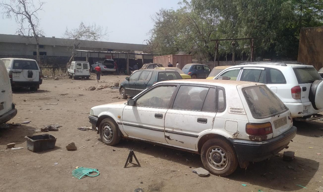
◀ Interior parcela de Norte a Sur)