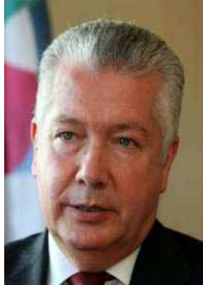
CIP – Confederação Empresarial de Portugal