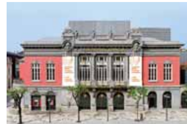
Theatro Circo - Braga