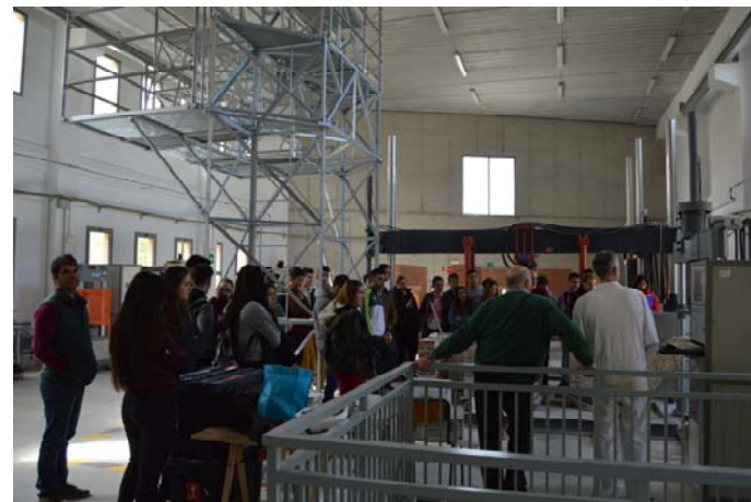
Asistencia de estudiantes de instituto