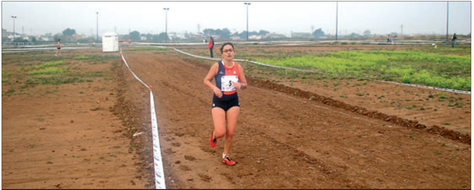
Una imagen de las pruebas de la competición universitaria del Grupo Levante en Castellón

La Universidad consigue el oro por equipos en el campeonato del Grupo Levante