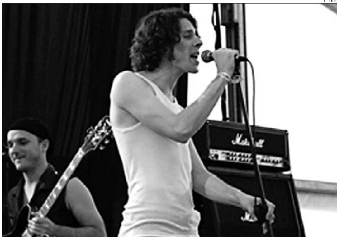
El hombre delgado actuará al Paranimf de la UA