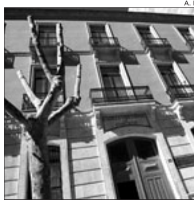
Sede de la Ciudad de Alicante