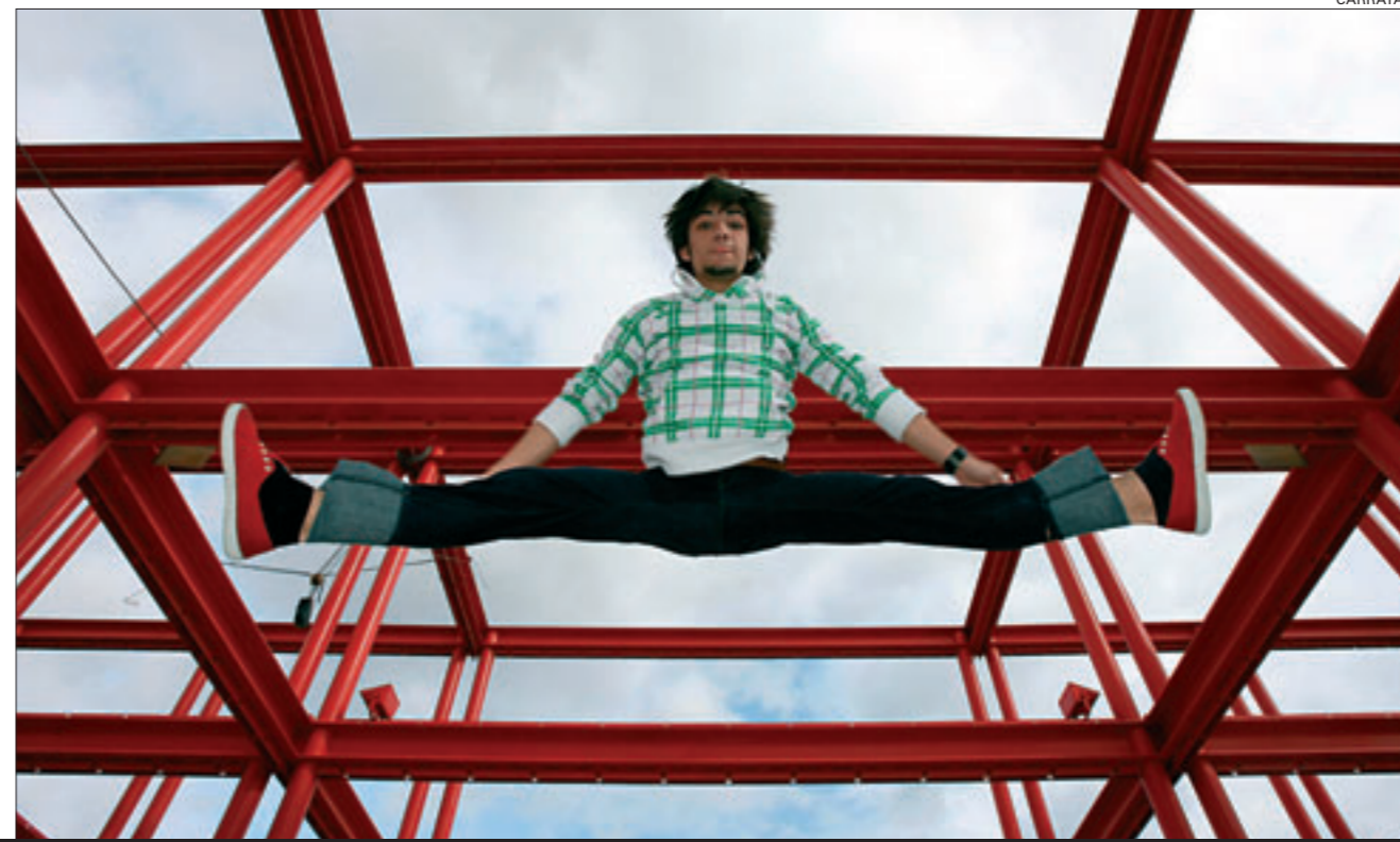
salto espectacular en la gigantesca estructura del anfiteatro del Aulario II